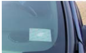
TAG UHF QWS