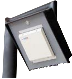
LECTOR UHF DE LARGO ALCANCE QLR-911