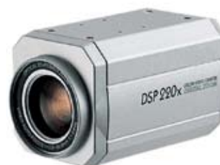
CÁMARA TIPO CAJA QZ2252