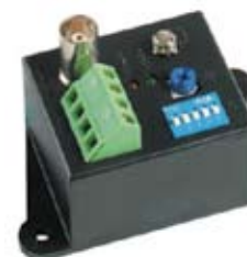
TRANCEPTOR ACTIVO QTTA111VR2