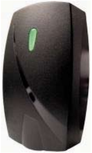
LECTOR DE PROXIMIDAD LXMR14/3I