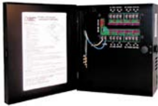
FUENTE CENTRALIZADA DE 24VAC PARA 8 CÁMARAS Q24AC16