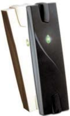
LECTOR DE PROXIMIDAD LXER14/3B