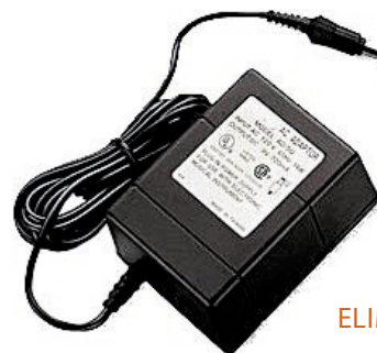
ELIMINADOR DE CORRIENTE 24VAC