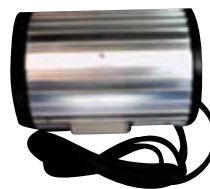
ILUMINADOR INFRARROJO QGSF850