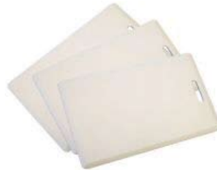
TARJETAS DE PROXIMIDAD CCTW0