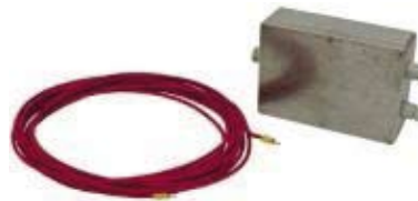
LECTOR DE PROXIMIDAD LBSR14/3B