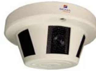
CÁMARA OCULTA EN SENSOR DE HUMO QE101