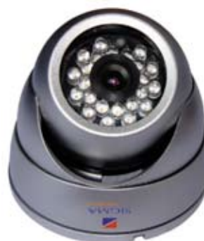
CÁMARA TIPO DOMO METÁLICO QE133C