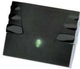
LECTOR DE PROXIMIDAD LXSR14/3B