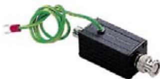
SUPRESOR DE RUIDO QGL001