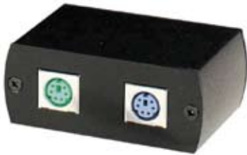
TRANCEPTOR PS2/UTP-485 QKM01