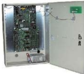
CONTROL DE ACCESOS QICA