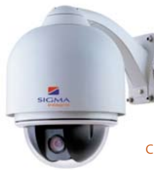
CÁMARA PTZ QP686B