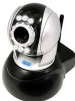
CÁMARA IP QEM6830M