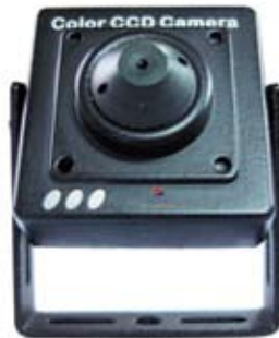
CÁMARA MINIATURA PARA INSTALACIONES OCULTAS QOS20P1