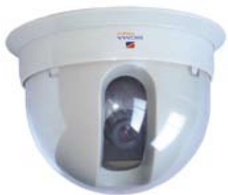
CÁMARA TIPO DOMO QE7962