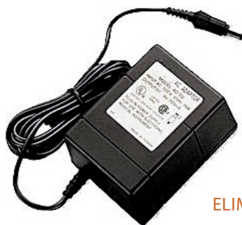
ELIMINADOR DE CORRIENTE 12VDC500