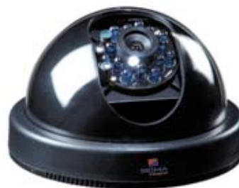
CÁMARA TIPO DOMO QS703LC