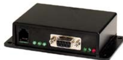
TRANCEPTOR ACTIVO RS-232 A RS-485 QRS002