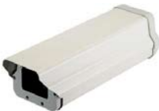
CARCAZA CON BRAZO QI605, QI606