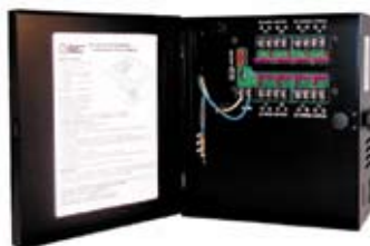
FUENTE CENTRALIZADA DE 12VDC PARA 8 CÁMARAS Q12DC8