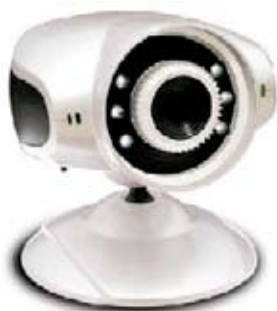
CÁMARA IP QEM6810B