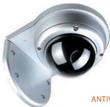
CÁMARA ANTIVANDÁLICA TIPO DOMO QS703FCVF