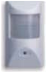
CÁMARA OCULTA EN SENSOR DE MOVIMIENTO QH611