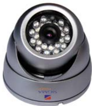
CÁMARA TIPO DOMO METÁLICO QE133D