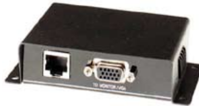
TRANCEPTOR VGA/UTP-232 QTP111VGA