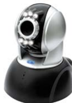
CÁMARA IP QEM6820