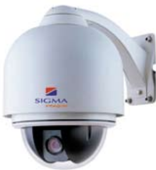
CÁMARA PTZ QS706CNB