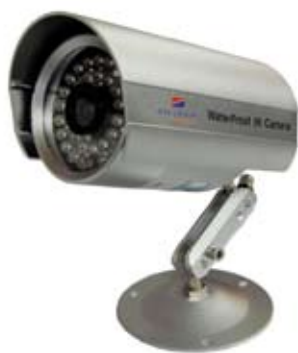
CÁMARA TIPO BALA QE113C