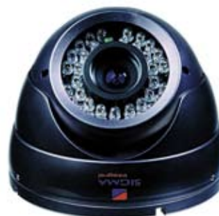
CÁMARA TIPO DOMO METÁLICO QE133A