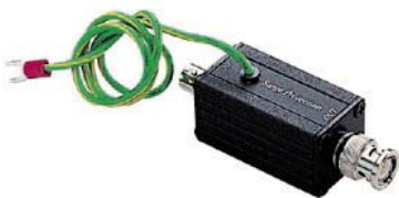
PROTECTOR DE LÍNEA QSP001H