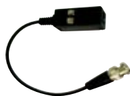
TRANCEPTOR PASIVO (BALUN) QTP111VLJA