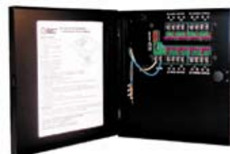
FUENTE CENTRALIZADA DE 24VAC PARA 8 CÁMARAS Q24AC8