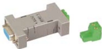
TRANCEPTOR PASIVO RS-232 A RS-485 QRS001