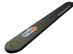
TAG UHF QMT